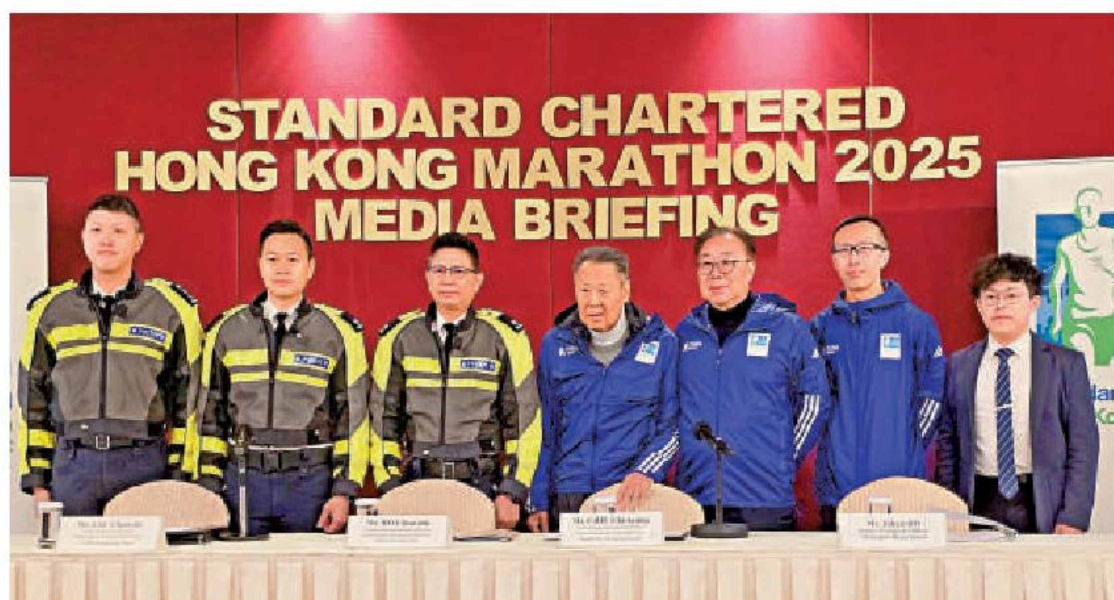
▲渣打香港馬拉松傳媒簡報會昨日召開。

運輸署和警方代表都在簡報會中表示，賽事舉行期間會有多個路段分階段封閉，附近路段亦會非常繁忙，呼籲駕駛人士盡量不要前往附近路段。而從2月8日晚間開始部分巴士路線會受到影響，屆時需看比賽進度重開，而部分道路重開後巴士路線才會陸續分階段恢復服務。