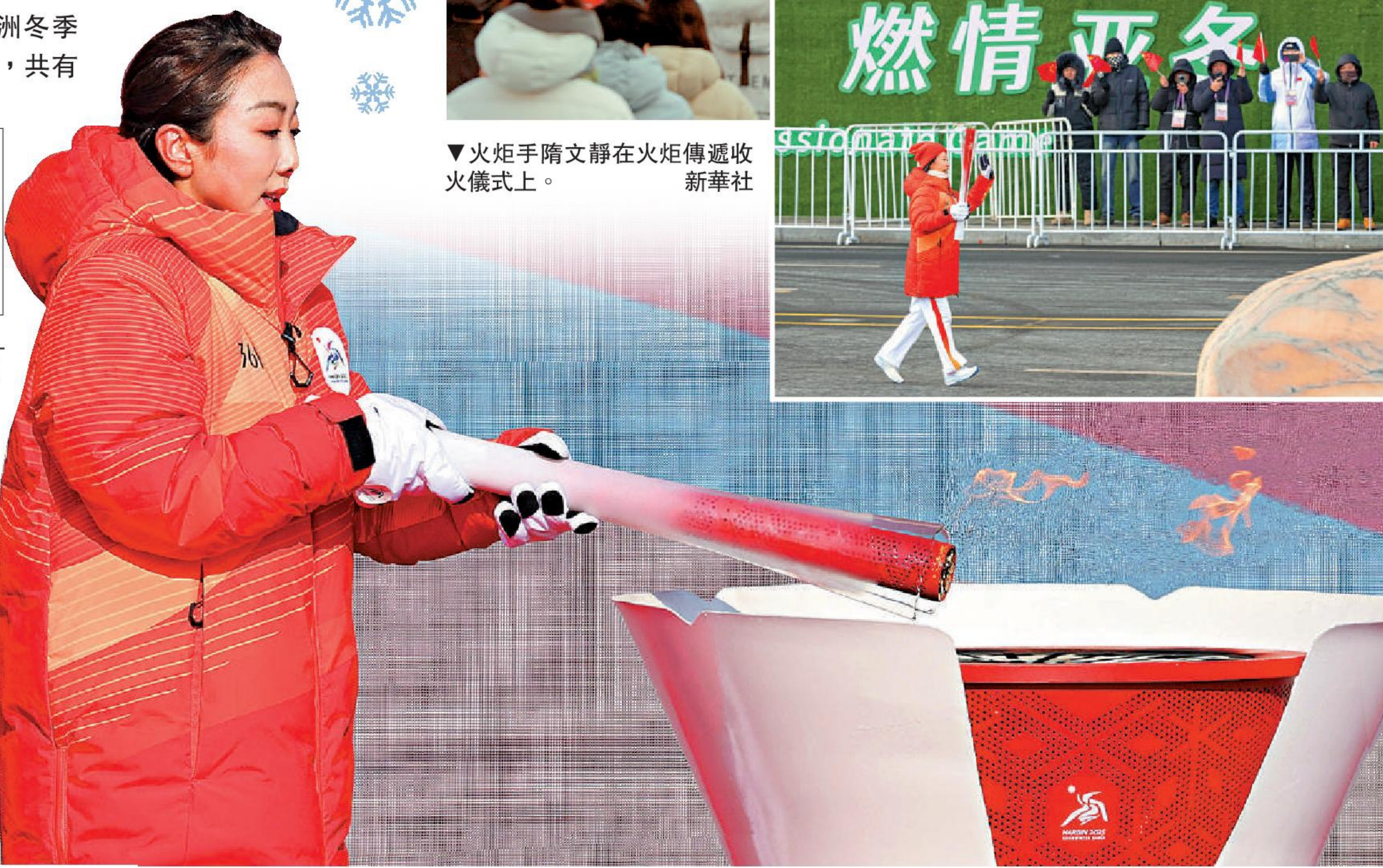
▼火炬手隋文靜在火炬傳遞收火儀式上。

本次火炬傳遞不僅是一次體育盛事，更是一次展示哈爾濱城市魅力的絕佳機會。圍繞哈爾濱市「雙亞冬之城」、「世界音樂之城」、「奧運冠軍之城」以及「國際冰雪藝術文化名城」的城市名片，活動還設計了多個群眾展演和互動打卡點，讓市民和遊客能夠親身感受哈爾濱的獨特魅力和文化底蘊。李娜說，在傳遞路線編制上，一方面落實簡約、安全、精彩的帶線要求，另一方面也要充分的展示火炬傳遞城市的自然風光、發展風貌、人文歷史還有城市魅力。最後確定了一條全長約11公里，穿越百年歷史的路線。